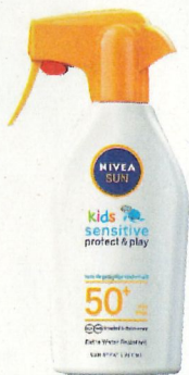
Nivea Sun Kids zonnep spray SPF50 € 23