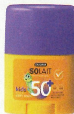
Kruidvat Solait Kids Sunstick SPF 50 € 6,50