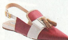
Muiltjes van Fratelli Rossetti € 520