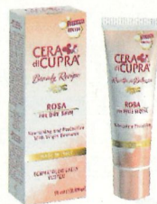
Cera di Cupra Rosa Crème voor de droge huid € 6,90