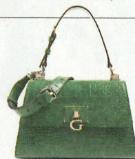
Fake crocotas van Guess € 149