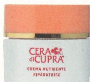
Cera di Cupra Col-lageen en Vitamine Crème € 16,90

■ De Italiaan Niccolo Ciccarelli was een enthousiast hobby-inkker en ontdekte in de jaren vijftig de bijzondere eigenschappen van bijenwas voor de huid. Het vormde de basis voor de producten van zijn Cera di Cupra dat ruim zestig jaar bestaat. Sinds dit jaar is het merk met zijn 'Ricetta di Bellezza' ook in Nederland verkrijgbaar via ceradicupra.nl .