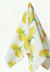
Citraentheedoek van Fabienne Chapot, 60 x 60 cm, € 9,95. debijenkorf.nl