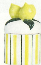
Voorraadpot met citroenhandvat. 16 cm hoog € 28,50, 25 cm hoog € 35. zaanschfaamwebshop.nl