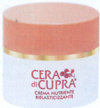
Cera di Cupra hyaluronic crème, 14,90 euro. www.ceradicupra.nl

Italiaans vinden wij altijd een hele mooie taal. Vroeger draaiden wij alles van Laura Pausini helemaal grijs en Pierre vindt ongeveer alle Italiaanse Eurovisie Songfestivalinzendingen geweldig. Gewoon omdat de taal zo lekker klinkt. Lekker, maar soms ook ingewikkeld, want deze crème van het Italiaanse Cera di Cupra heet: Crema Nutriente Rielasticizzante. Bij Cera noemen ze het ook wel hyaluronic crème. Klinkt iets makkelijker. Het is een water-in-olie-emulsie met een lichte textuur. Doet het goed op de droge huid door de formule die gebaseerd is op hydraterende natuurlijke extracten (honing!) in combinatie met hyaluronzuur, vitamine E en andere krachtige antioxidanten. Je bestelt hem online, dus over de ingewikkelde naam hoeft je niet te struikelen in de winkel.