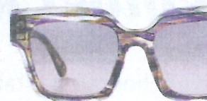
Etnia via NanaWoodyandJohn