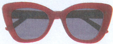
Zara, 29,95 euro.