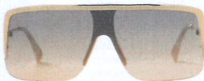
AM Eyewear via NanaWoodyandJohn, 219 euro.