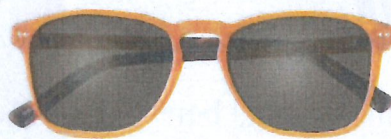
Monkfish via Specsavers, 109 euro.