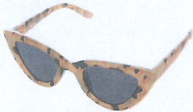
Pull and Bear, 12,99 euro.