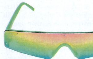
Bershka, 9,99 euro.