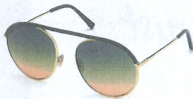
Tod's, 275 euro.