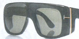
Tom Ford, 320 euro.