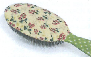
Rock & Ruddle haarborstel, 47,95 euro (o.a. bij www.skins.nl ).